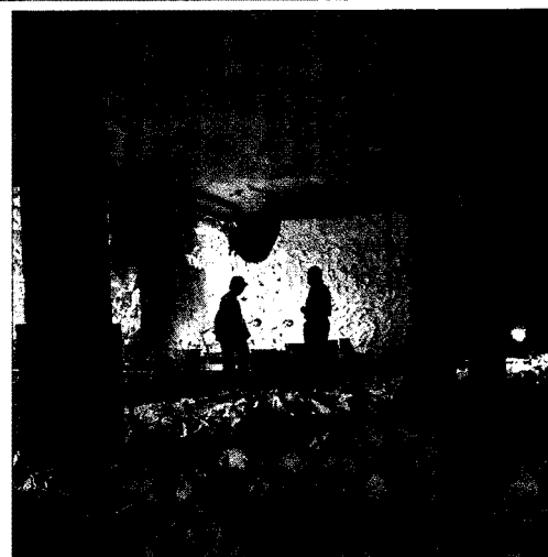
Arriba, los juzgados de Antequera; abajo, escenografía de Ferrater y espacio de Gironés.